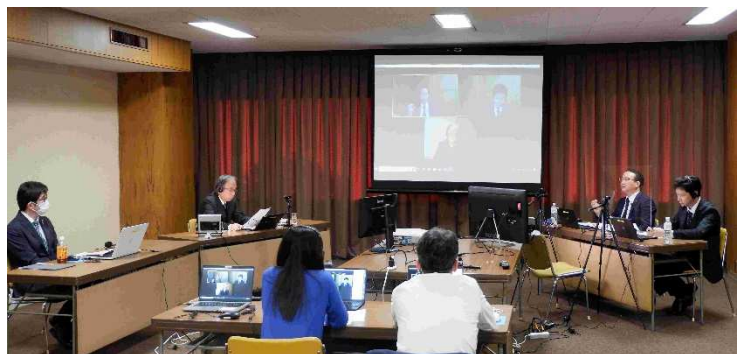
Web 配信会場(パネルディスカッションの様子)